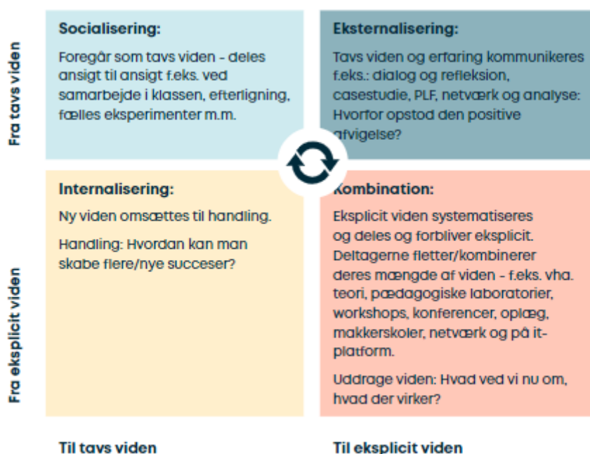
Figur 7. Nonaka & Takeuchi (1995:62)

Med udgangspunkt i Nonakas & Takeuchis SECI-model, som fremgår af figur 6, vil vi derfor arbejde med videndeling på flere forskellige måder i projektet. Ifølge SECI-modellen bliver viden skabt i samspillet mellem tavs og explicit viden. SECI står for socialisering ('socialization'), eksternalisering ('externalization'), kombineret ('combination') og internalisering ('internalization') og beskriver fire måder, hvorpå vidensformer omformes til andre vidensformer.