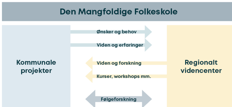
Figur 3. De to spor i Den Mangfoldige Folkeskole

De kommunale aktionslæringsforløb består grundlæggende af fem faser (Bayer, Plauborg & Andersen, 2007), som fremgår af nedenstående figur.