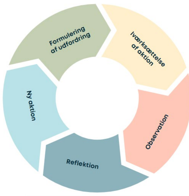
Figur 4. De fem faser i aktionslæringsforløbene

De kommunale aktionslæringsforløb består grundlæggende af fem faser (Bayer, Plauborg & Andersen, 2007), som fremgår af nedenstående figur.