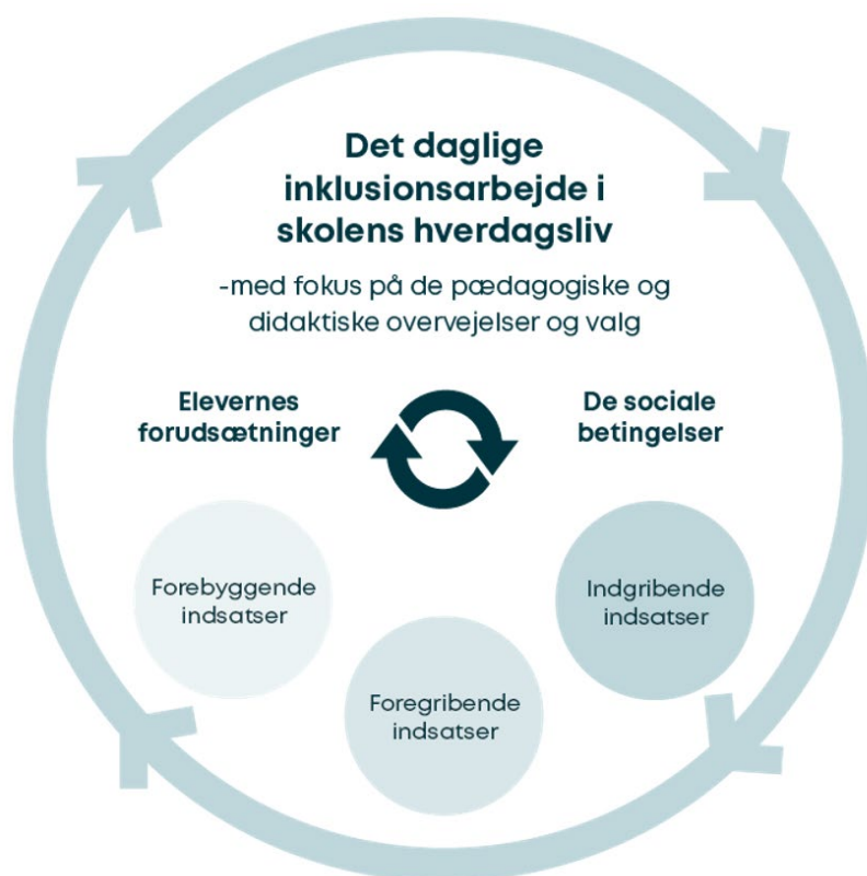
Figur 2: inklusionsgrundlag

I aktionslæringsforløbene tages der udgangspunkt i det daglige inklusionsarbejde, som knytter sig til de fagprofessionelles pædagogik og didaktik, og der arbejdes desuden med forskellige niveauer af indsatser i forhold til de skolevanskeligheder og udskillelses- og eksklusionsprocesser, der hele tiden foregår i et klassefællesskab. Vi skelner derfor mellem forebyggende, foregribende og indgribende indsatser (Fisker 2014), der både kan rette sig mod hele elevgruppen, grupper af elever eller være specialiserede indsatser eller interventioner tilpasset enkelte elever.